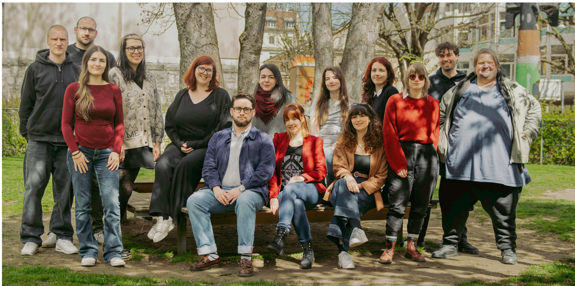
Parc Gourgas, Mars 2026

Ensemble, continuons de faire rayonner la magie des camps de vacances !